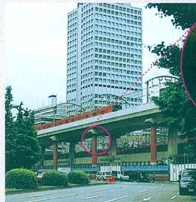
● 東京駅丸の内側(エンタシス状鋼管—化粧前)